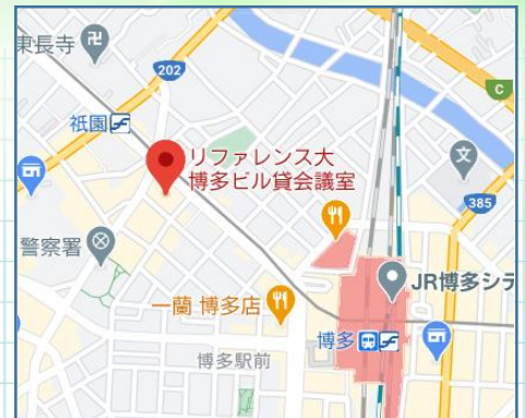
リファレンス大博多ビル

リファレンス大博多ビル会議室1202 オンライン (ZOOM)のご利用が難しい場合や、 リアル受講で講師や受講生との意見交換を行いたい場合は、 福岡会場までお越しください